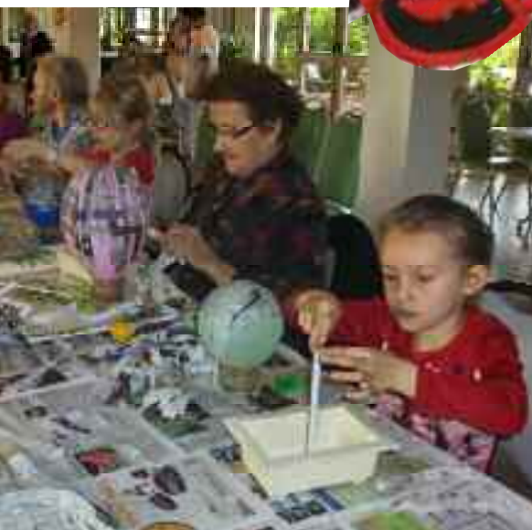
À la Maison de retraite, les enfants découpent et peignent avec les anciens.