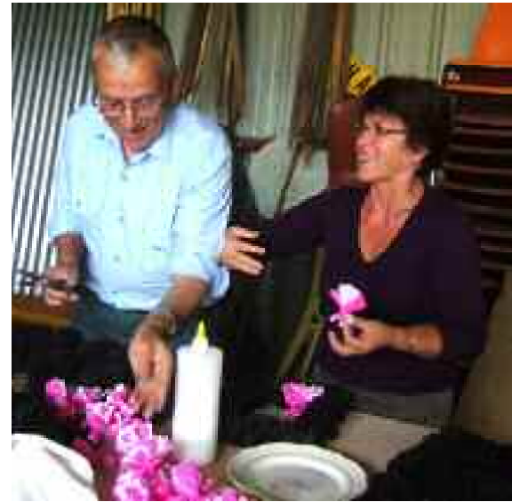
Encore des fleurs à Chanoy.

La même animation a régné dans les autres communes du canton, à Beaulieu-sur-Loire, Pierrefitte-es-Bois, Cernoy-en-Berry, Saint-Firmin-sur-Loire et Autry-le-