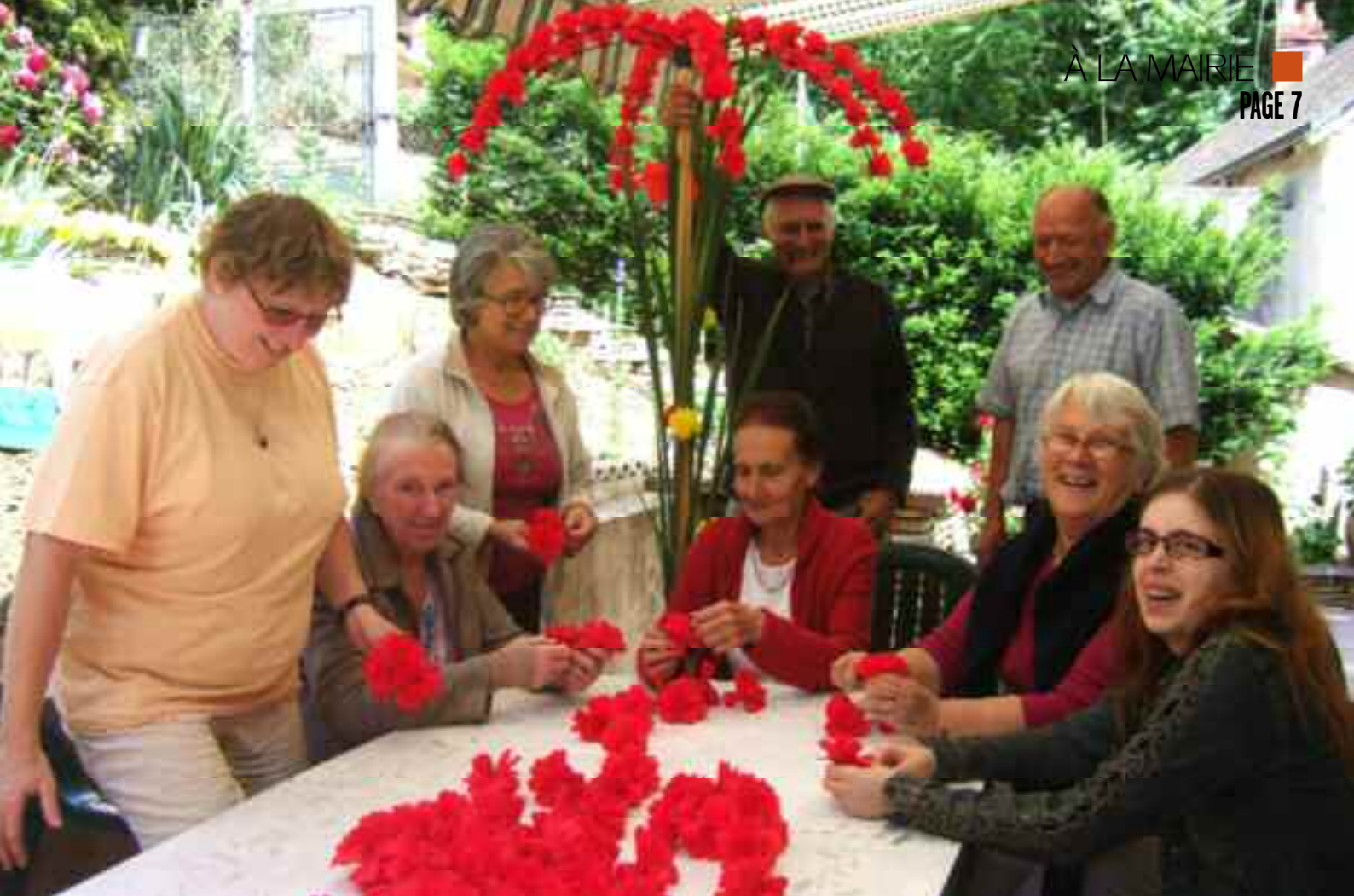
Quartier rue de Gien – rue de la Marne, des arbres fleuris, exotiques et joyeux !