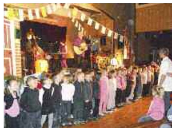
Le vendredi 15 avril au Centre Socio-culturel.