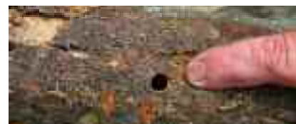
Le trou rond laissé par le Capricorne asiatique dans les arbres qu'il infeste.

Repéré par un étudiant dans un parc de Gien, le capricorne asiatique serait arrivé de Chine dans du bois de palettes. L'alerte a été immédiatement donnée pour enrayer l'invasion de cet insecte qui s'attaque aux arbres vivants, en particulier les érables, les saules, les bouleaux ou les arbres fruitiers que ses larves tuent à grands coups de mandibules. L'insecte est noir à points blancs, muni de longues antennes et mesure quatre centimètres de long. Les arbres qui portent ses traces, des trous ronds de 0,7 à 1 cm de diamètre, doivent être abattus et brûlés sur place. Attention de ne pas le confondre avec le grand Capricorne qui lui, est tout noir, ne se développe que dans le bois mort et est protégé.