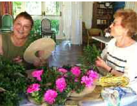
Des fleurs dans tous les quartiers, ici à Nancray et rue de Pierrefitte (en dessous).

a choisi d'arrêter l'horloge des saisons au « Printemps » avec des décorations de fleurs, d'insectes et d'oiseaux réalisées par les résidents avec leur animatrice. Peintes, constituées de fleurs de papier ou fabriquées en papier mâché, les petites bêtes seront disposées sur le mur et la haie parmi d'étranges messieurs aux allures d'épouvantails.