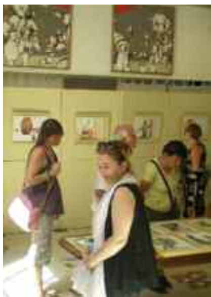
Visite d'atelier lors de la Journée des Arts dans la rue 2010.

La journée des Arts dans la rue se tiendra, cette année, le dimanche 17 juillet, dans tout le centre ville.